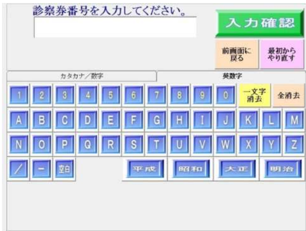
電話番号登録側（患者受付）