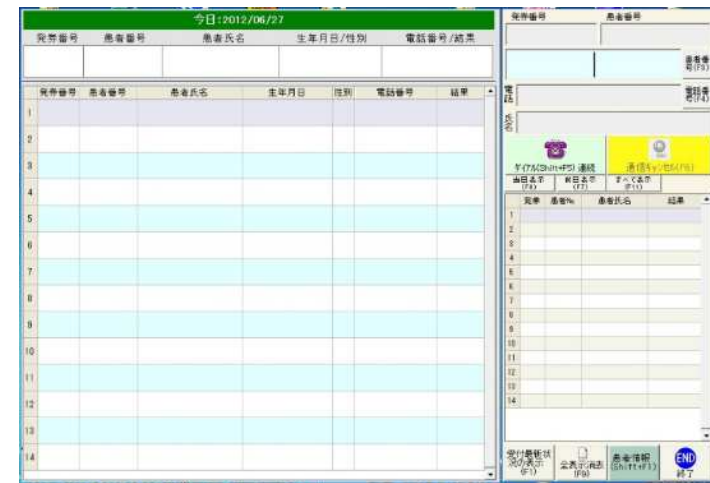
ダイヤル側（医療機関受付）