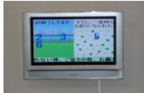
【診察終了患者表示 ～ 外出中呼出患者表示】