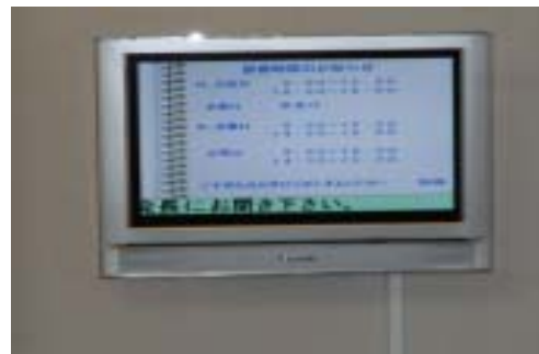
【診療時間のご案内】