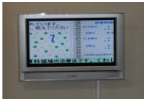
【外出中呼出患者表示 ～ 診療時間のご案内】